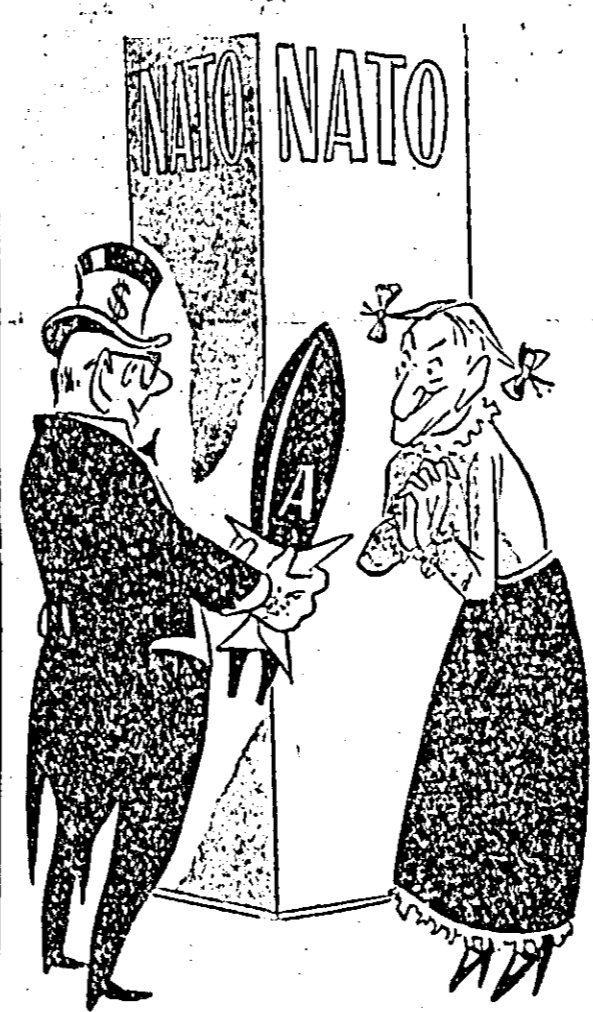
O întâlnire la care visează foarte mult d-l Adenauer. (Desen de Rik Anerbach)

În legătură cu politica de reînarmare a Germaniei occidentale, Bonnul caută să strecoare cit se poate de repede prin Bundestag sistemul legilor excepționale care „în caz de nevoie” ar permite oamenilor capitalului monopolist să introducă o dictatură nelimitată. În acest scop, scrie ziarul „Die Welt”, cancelarul federal Adenauer și ministrul Afacerilor Interne, Hoescherl „au conferit” în legătură cu legislația excepțională cu președintele fracțiunilor Bundestagului de la Bonn, Brentano (UCD), Ollenhauer (PSDG) și Men-