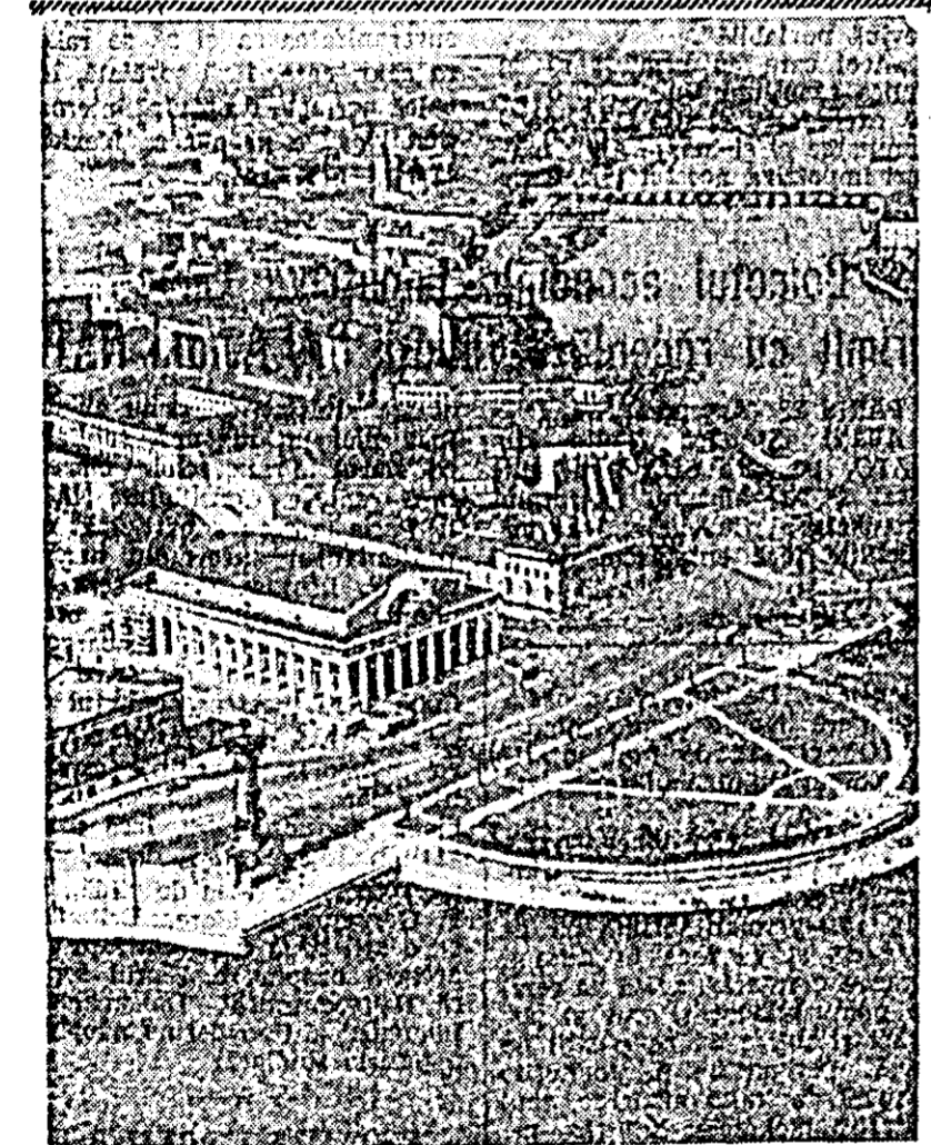
vedere din Leningrad

La fabrica „Republica” din Sibiu vor intra în cursă în producția de serie la mobilierul de bucatărie tip „Renata” — plăcuțe fibro-limboase livrate de combinatul de industrializare a lemnului din Blaj. Plăcuța de fibră înlocuiește placajul și este în același timp mai rezistentă. În viitor aceste plăci vor căpăta un finisaj superior prin emalare sau metalinare (acoperirea cu un strat de rășină sintetică, care asigură o pețoală lucioasă și foarte rezistentă la solicitări mecanice).