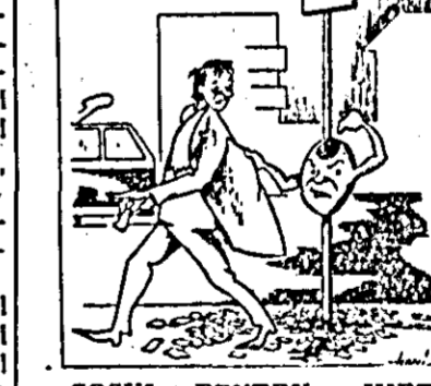
COȘUL PENTRU HÎRȚII: De-aș putea proceda și în realitate ca în desen...

Mal sint unii cetățeni neglijenți care aruncă bilețele de tramvai și alte hîrții pe trotuar. În întimplare, deși protundul sint coșuri destinate acestui scop.