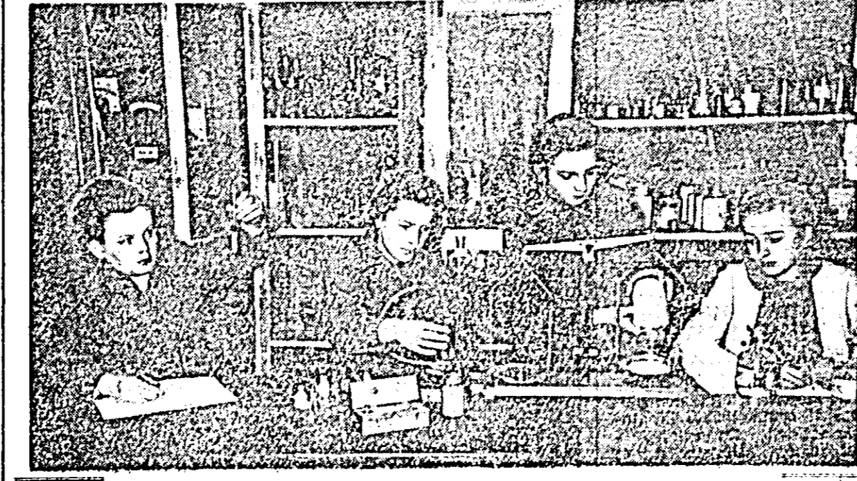
Elevii de la Școala de 7 ani din Vladimirescu au la dispoziție un laborator bine dotat, care le dă posibilitatea să efectueze o serie de experiențe interesante, îmbogățindu-și cunoștințele de fizică și chimie. IN CLIȘEU: în laborator, elevii din clasa a VII-a fac experiențe la o oră de chimie.

odihnă” de V. Kataev și un montaj literar pe tema luptei pentru pace. Intregul repertoriu a fost prezentat, fiind în cont de limitele amatorismului, la un nivel artistic ridicat. Colectivele de interpreti ale celor două piese au fost omogene. Replicile au „curs” în mod firesc, fără poticniri, mișcare în scenă (cu excepția unor precipitări în ultima parte a piesei „Cereră în căsătorie”) a fost adecvată, iar machiajul executat destul de corect. În desfășurarea pieselor s-a observat că artiștii amatori sînt bine familiarizați cu scena, știu să se miște corect pe ea. Spectacolele oferite de colectivul artistic de la IPMS „Gravura” și „Ardeanca” dovedesc că aici s-a muncit cu simț de răspundere în vederea concursului, că și în întreprinderile mici se pot realiza lucruri mari pe tărîm cultural.