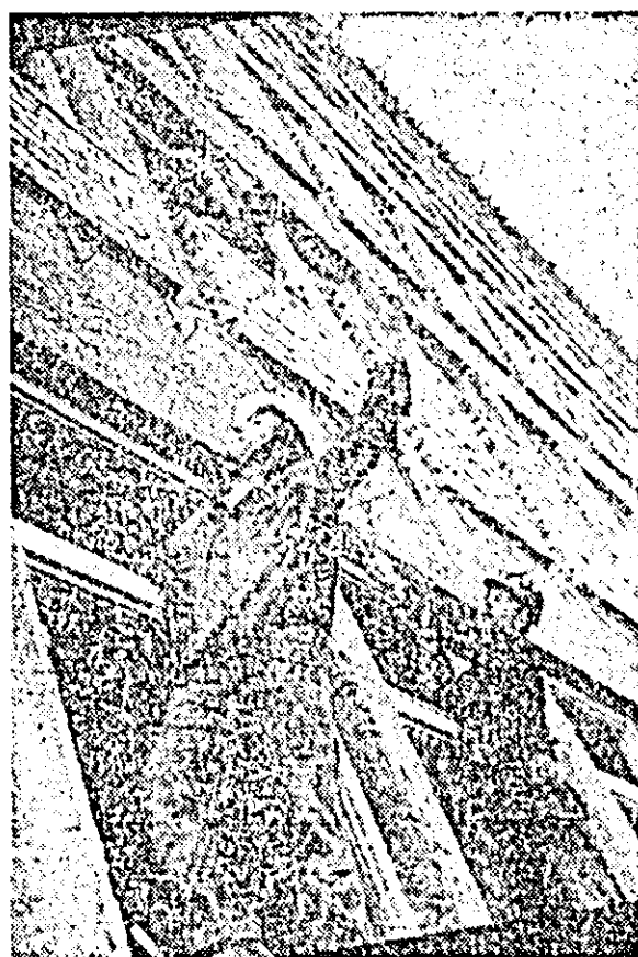
Paisajul arhitectonic din municipiul nostru se îmbogățește cu o nouă construcție: pavilionul administrativ al Uzinelor de vagoane.