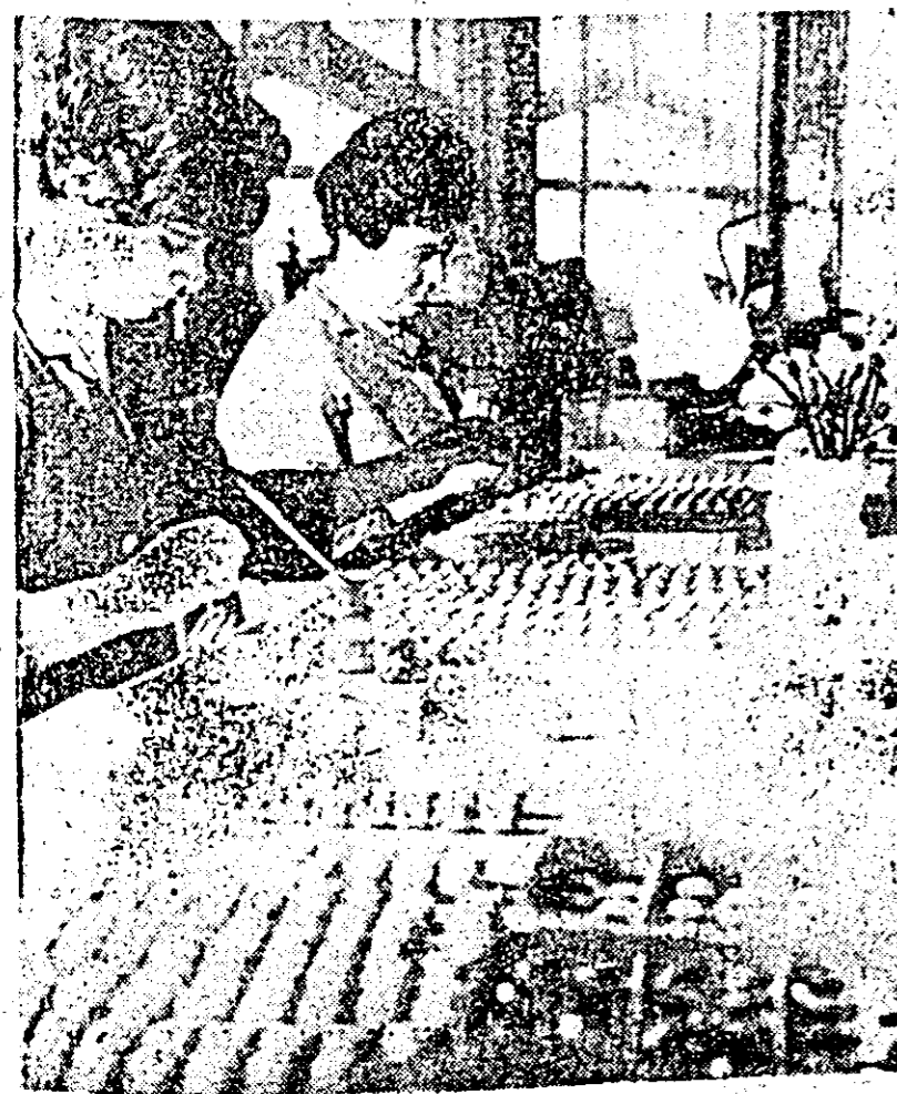
O masă de lucru la care mîini îndeminate produc în serie bucurii pentru fetițele noastre. Deduceți, desigur, că imaginea noastră înfățișează un aspect obișnuit de muncă din atelierul de pictură al fabricii „Arădeancă”, unde se conturează expresia, ce-i drept, în ultimul timp foarte frumoasă, a păpușilor fabricate la Arad.

Folosirea unor materiale mai aspectuoase și calitativ superioare celor anterioare au făcut ca umbrelele marca „Electrometal” să devină un produs foarte soli-