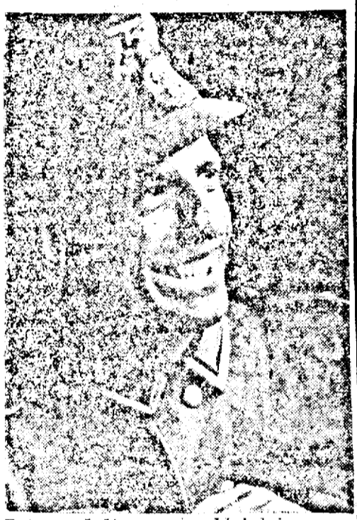
Fața surzătoare a soldatului german biruitor