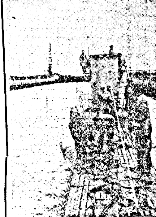
Întorcerea unui submarin german la baza sa, după îndeplinirea misiunii sale