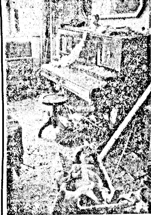
Întă cum se înfățișează o locuință atinsă de o bombă lansată din avion