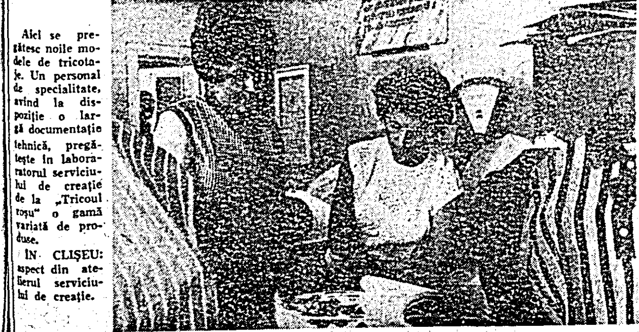
Aici se pregătesc noile modele de tricotate. Un personal de specialitate, avînd la dispoziție o largă documentație tehnică, pregătește în laboratorul serviciului de creație de la „Tricoul roșu” o gamă variată de produse. ÎN CLIȘEU: aspect din atelierul serviciului de creație.