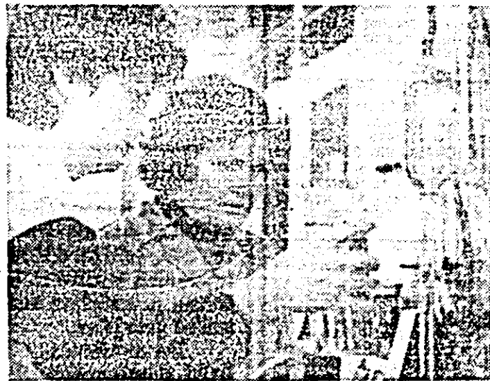
În laboratorul de analize fizico-chimice al întreprinderii de orologerie industrială.

La tragerea la sorti pentru trimestrul IV — 1987 a cîștigurilor în numerar ce se atribuie libretelor de economii cu dobîndă și cîștiguri, care în tot cursul trimestrului au avut un sold de 5 000 de lei, județul Arad, li revin următoarele numere de librete cîștigătoare: 702-1-42641, 702-1-209801, 702-1-354917, 702-1-209013, 702-218-37094, 701-158-450, 702-1-373754, 702-1-248940, 702-222-2611, 701-157-1312, 702-1-371326, 701-146-2682, 702-1-369534, 701-222-501, 702-1-379950, 702-1-320462, 702-1-276961, 702-255-439, 702-1-137777, 702-208-10227.