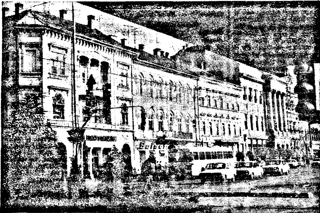
Arad, vedere din Piața Revoluției.