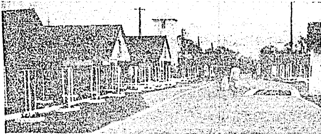
Iată cum se prezintă ferma zootehnică Radna, a C.A.P. Lipova, adevărat exemplu de bună gospodărie.