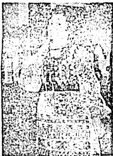
pentru oameni, pentru bucuriile lor, cîntă pentru viața fericită ce-o trăim. Și nu e cunoscută doar în Arad, în rîndul constructorilor de vagoane, ci aproape în întregul județ pe unde orchestra de muzică populară a întreprinderii de vagoane