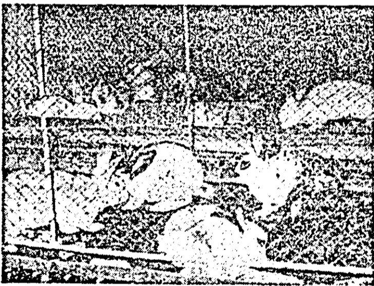
Și la C.A.P. Secușigă funcționează cu bune rezultate o crescătorie de iepuri.