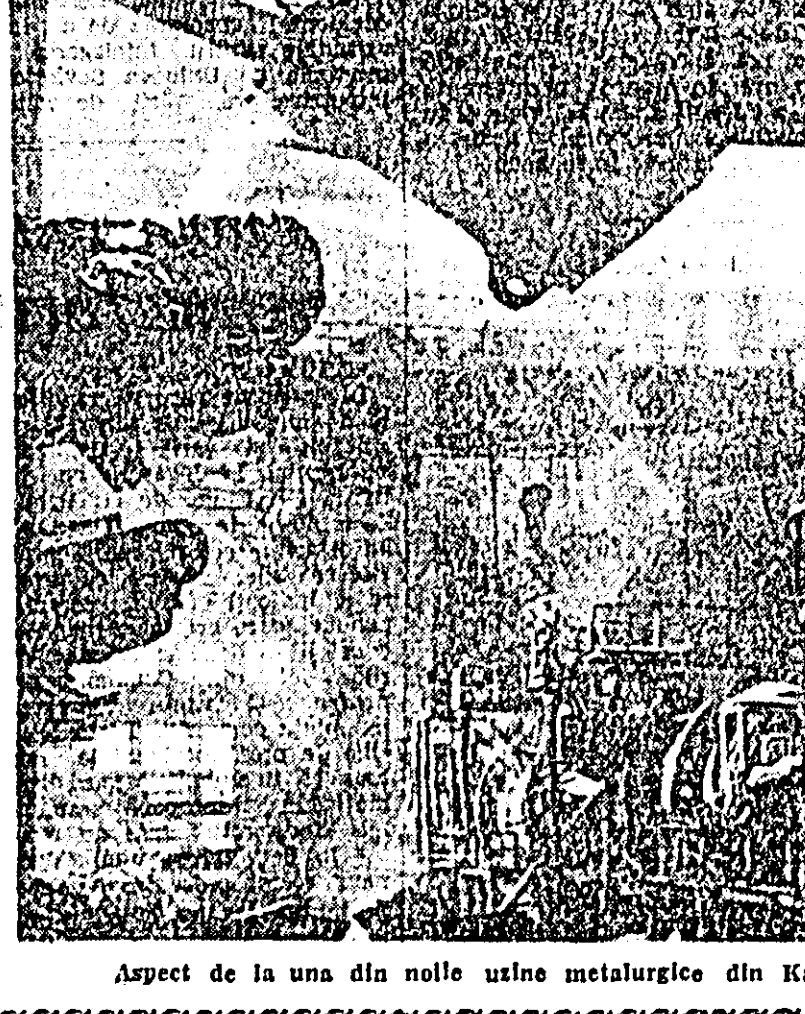
Aspect de la una din noile uzine metalurgice din Kazahstan.