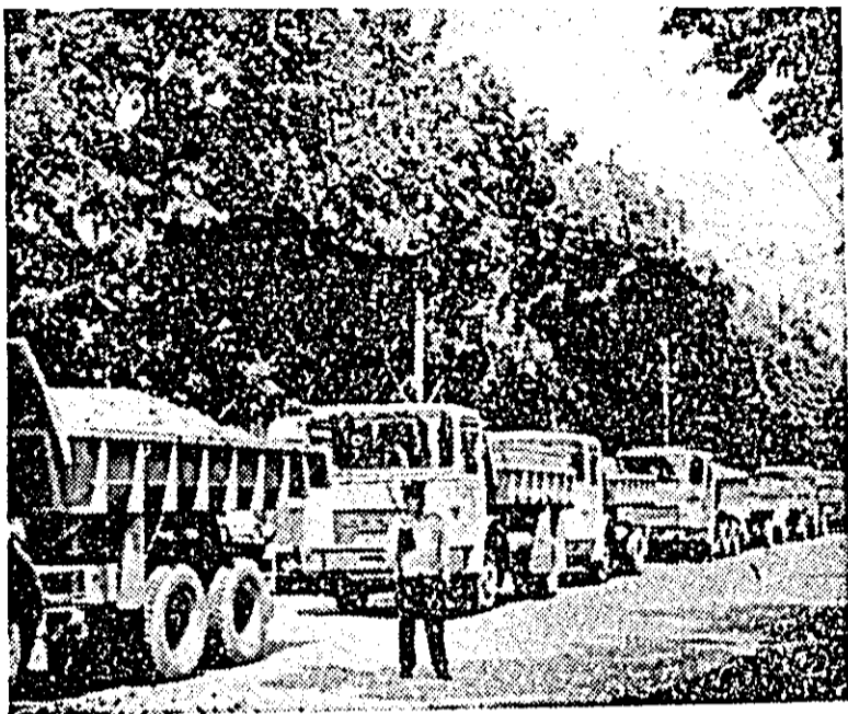
Autovehiculele întreprinderii de transporturi auto Arad 1,1 lau startul cu o nouă încărcătură.

Oameni ai muncii arădeni! Să dovedim fermitate și bărbăție, întreaga noastră abnegație patriotică în lupta cu stihiiile naturii!