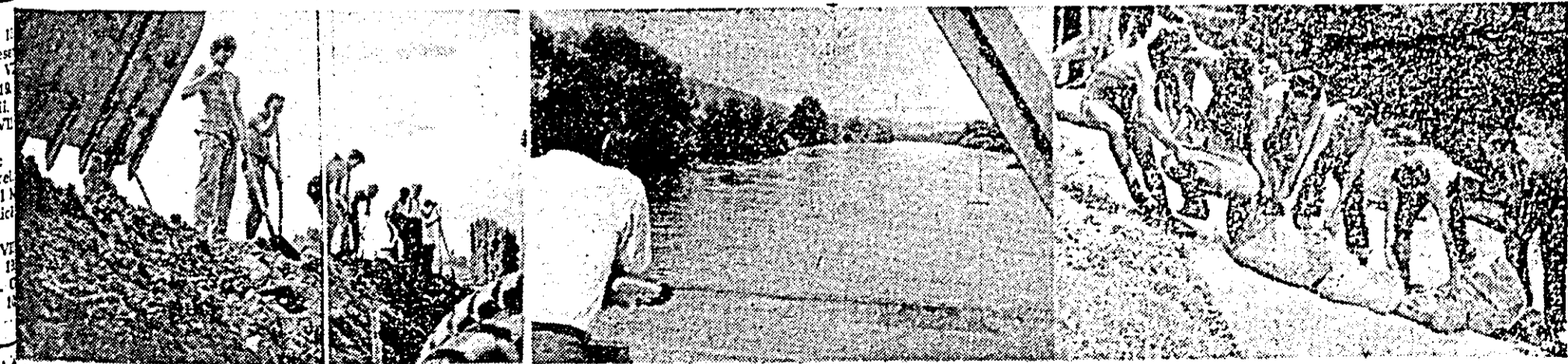
Pe frontul luptei cu apele Mureșului în creștere, muncitorii și ostașii sînt la datorie.