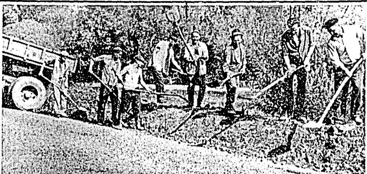
Pe Mureș — în amonte — se ridică noi stavile în calea apelor.

umane și materiale ale învecinate. Am văzut la cului chipul frumos al a trajectorii cînd pe o hectare cu griu s-au a atitea combine și oame se și seceri, încl în na ore tot lanul era litera vada. Am întâlnit coșul gol și pantalonii sâ te gonunchi, stîngînd go-podărească ficcari tulpină de griu care faze de ploii ori vîntu locuri de apa ce bălta. — E soțul nostru roșu, pe care l-am cultivat și nu-l vom lăsa acum riciu apelor, au spus hotărîți alți mecanizatori peratorii din Zădăreni, din Felnac. Lor li s-au lucrători și funcționari unități de pa raza com astfel, toți laolaltă au nă ieri toată recolta din la afată în calea apelor. — Mă simt pur și simpșit de dăruirea și abne care au muncit cu totîng. G. Burecu, președinte Zădăreni, încl dacă nu pe cine să evedențiez eșe sînt oameni minunați, e nari! A. HAI