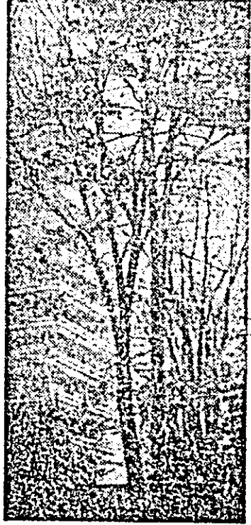
Toamnă țirlez.

Na uități să vă reînnoiți abonamentele la presa loca-lă „Flacăra roșie” și „Vôros Lobogo”, pentru anul 1987. Se reînnoiesc, de ase-menea, abonamentele la presa cotidiană centrală „Scîntela”, „România liberă”, „Scîntelea tineretului”, „Elo-ro” „Noua Weg”, reviste-le „Era socialistă”, „Munca de partid” și celelalte pu-blicații preferate. Abonamentele se contrac-tează prin oficiile P.T.T.R., factorii poștali, agențiile P.T.T.R. și distribuitorii obștești din întreprinderi și școli.