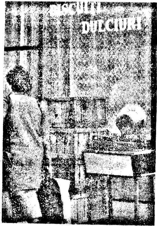
Aprovizionarea de toamnă, așa cum se vede prin obiectivul fotoreporterului.