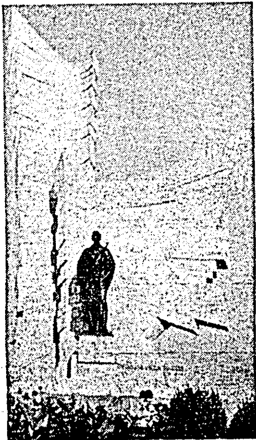
„Monumentul eroilor” de la Păuliș.