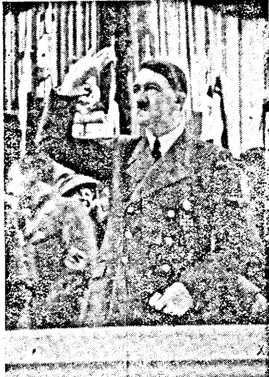
Führerul vorbind la Sport-palast Berlin cu ocazia inaugurării operii ajutorului de iarnă.

stagionul pe ziua de 1 Octombrie, reprezentându-se în chip fastuos „Nunta lui Figaro”. Concomitent se lucrează cu spor la renovarea Teatrului Național avariat din Belgrad, scontându-se redeschiderea lui peste câteva zile.