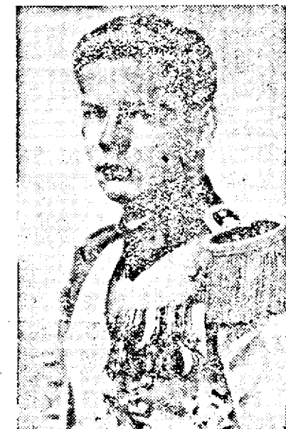
M. S. Regele Mihai I.

Dar astăzi, când putem spune, că, pericoiul cel mare e înlăturat și diabolica rula- ia internațională predomi-