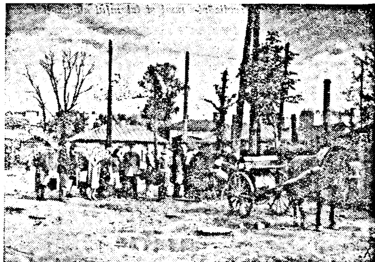
Kiev. În retragerea lor bolșevicii nu s'au mulțumit numai cu distrugerea caselor, dar au nimicit și conductele de apă. Populația se privește cum poate din puturi. (PK. Ob.)

Neștiut de nimeni — voi muri Atâta tinerețe care moare și eu... în toamnă: sau în carene de primăvară M'or năpădi uitările curând! Ce trist destin avui în lumea asta — Va mângâia durerea celor cari Să-mi steie dorul răstignit p'un. Au lacrimat și pentru mine — te rând! PETRE A. BUTUCEA