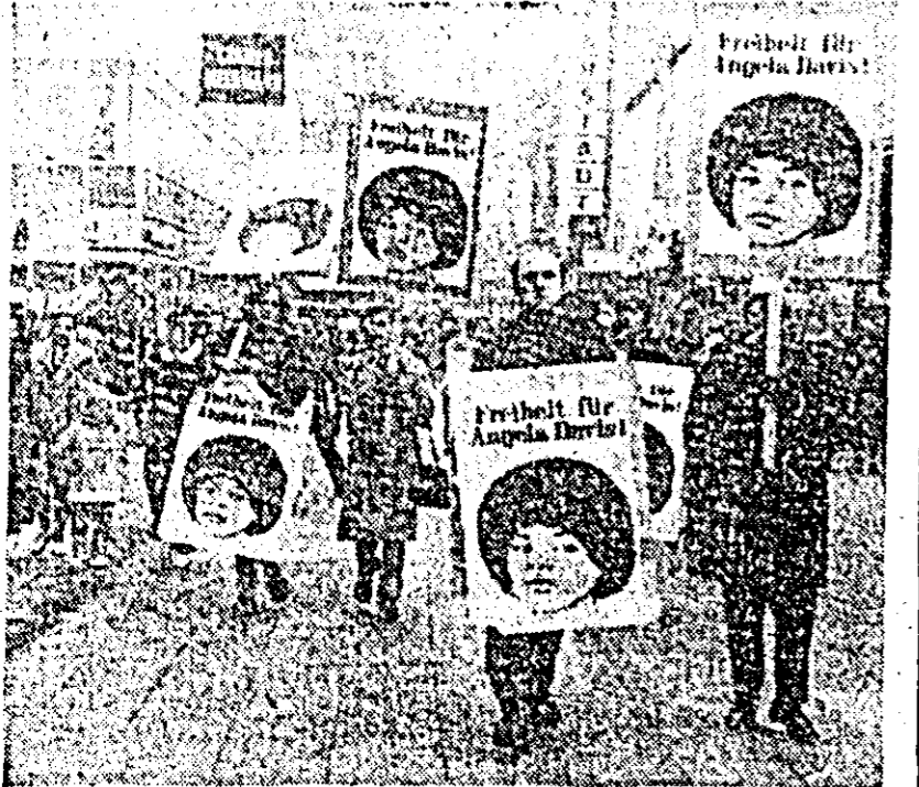
R. F. A. GERMANIEI. În fotografie, o demonstrație la Dortmund, pentru eliberarea militanței de culoare pentru drepturi civile, prof. de psihologie Angela Davis.

WASHINGTON 28 (Agerpres). — După cum s-a anunțat, în orașul San Jose, din California, a început procesul intentat militanței americane de culoare Angela Davis, membră a CC al PC din Statele Unite. Deși Angela Davis și avocatii apărării au cerut, în repetate rânduri, în scopul asigurării unui proces obiectiv ca acesta să nu fie judecat la San Jose, ci în altă localitate, în care influența cercurilor reacționare și rasiste să nu poată avea repercusiuni asupra dezbaterilor, toate cererile au fost respinse. Mai mult, încercările avocatilor apărării de a determina admiterea în jurul procesului și a unor persoane de culoare au fost, de asemenea, respinse, fapt care ar putea afecta desfășurarea procesului.