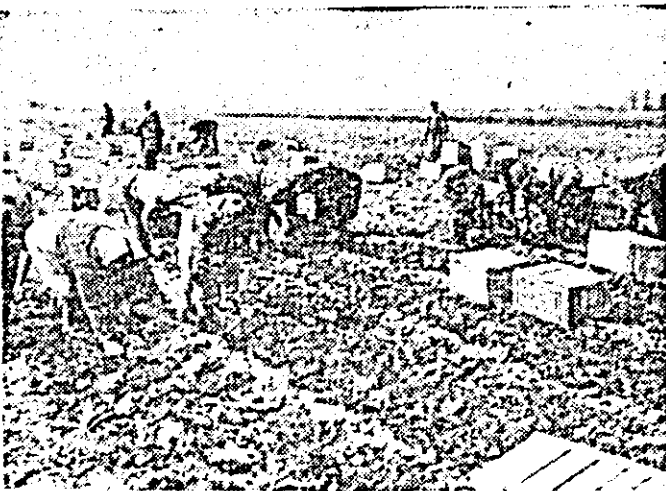
La cooperativa agricolă de producție „Victoria” din Nădlac se lucrează intens la plantarea tomatelor timpurii.

Text și foto A. LEHOTSKY, subredacția Nădlac