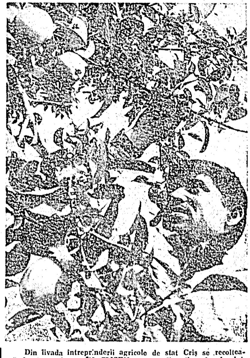
Din livada întreprinderii agricole de stat Criș se recoltează fructe gustoase, IN CLIȘIU: aspect din timpul culesului.

spre aeroport, numeroase grupuri de cetățeni au ținut să-și ia rămas bun de la înalții oaspeți români. Înșiruiți pe străzile străbătute de coloana oficială de mașini, ei flutură stegulețele tricolore, române și cehoslovace, fac semne prietenești cu batiste și eșarfe, așită buchete de flori. Conducătorii români și cehoslovaci răspund cu cordialitate entuziasmului cu care praghezii însoțesc trecerea coloanei. Cortegiul oficial sosește la aeroportul „Ruzyne”, pavoazăct cu drapelurile de stat ale celor două țări. Împodobit cu lozinci de rămas bun în limbile română și cehă. La aeroport se află: Oldrich Cernik, președintele guvernului cehoslovac, ceilalți membri ai delegației cehoslovace care au participat la convorbiri, precum și alte persoane oficiale, reprezentanți de seamă ai vieții politice, publice și culturale, ziariști cehoslovaci și străini. Sint prezenți Ion Obradovici, ambasadorul României la Praga, membrii Ambasadei și ai coloniei române, șefii altor misiuni diplomatice. Președintele Nicolae Ceaușescu, însoțit de președintele Ludvík Svoboda și Alexander Dubček, primește raportul comandantului (Cont. în pag. a IV-a)