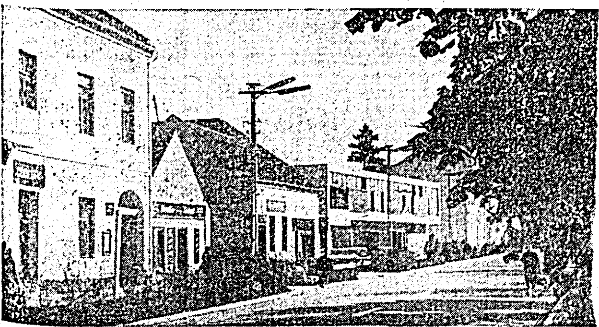
Nou și vechi în orașul Ineu.

mică alfluță la chioșcuri? — Ne urmăm liniștit, alăturîndu-ne fluxului uman de pe bulevard. În dreptul cafenelei de lângă magazinul „Universal”, cineva e căta să cadă. Misteriu? Căci în groapa care se cascadează (de cîtă vreme?) în asfaltul trotuarului. O fi fost omul neatenț, cum spuneau unii, dar e asta o scuză pentru edilii municipiului? Nicidecum. O acu- I. CEZAR (Cont. în pag. a III-a)