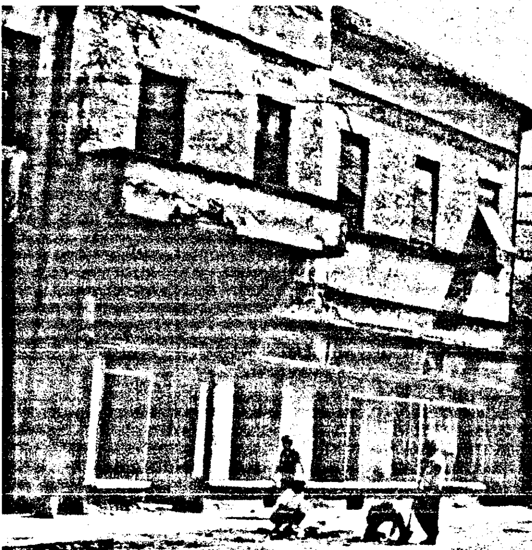
În timp ce Aradul se confruntă cu o acută criză de locuințe, multe clădiri (cum este aceasta de pe str. Tribunal Dobra nr.17) sunt nelocuite din cauza stării avansate de degradare.