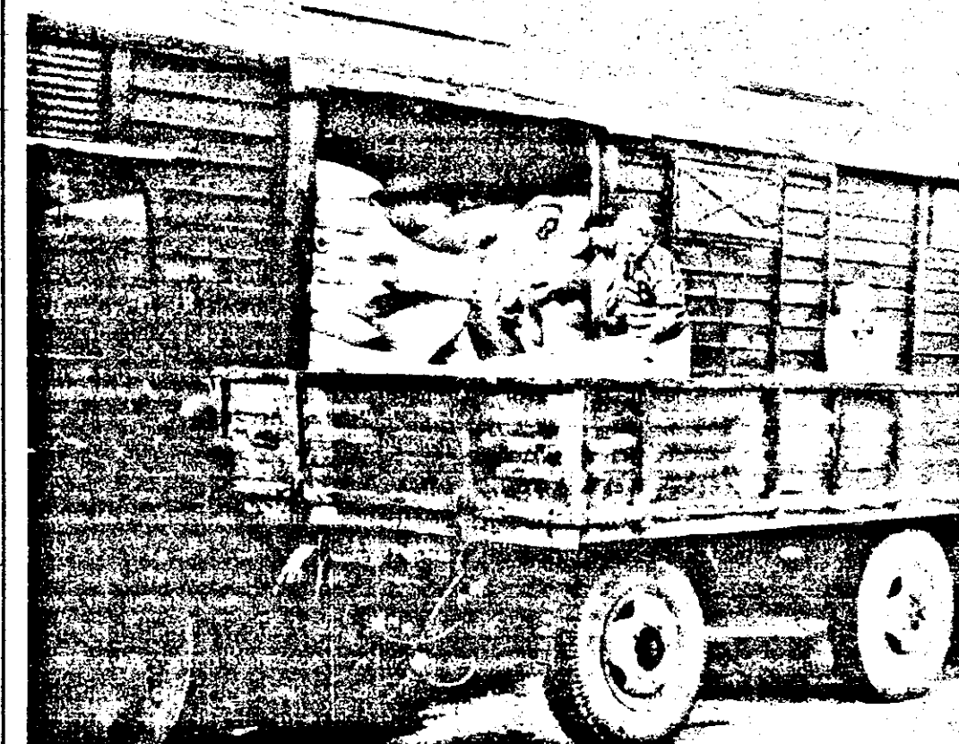
A sosit un nou transport cu îngrășăminte chimice destinate agricultorilor privați. Din păcate, prețurile foarte mari le fac aproape inaccesibile mării majorități a agricultorilor.