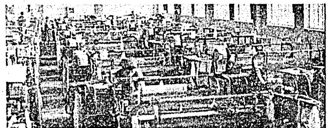
Aspect de muncă din secția țesătorie I a Întreprinderii textile.

cîmp ultimele 1700 tone sîcică de zahăr. De coceni a fost eliberată o suprafață de 295 ha și au fost luate măsurile ca să se adune cât mai repede cocenii și pe restul terenului. O altă măsură se referă la fertilizarea terenurilor ce vor fi semănate în primăvară. Terenul destinat culturii sîcicii de zahăr se fertilizează: 110 ha cu îngrășăminte organice și 150 ha cu îngrășăminte chimice, iar suprafața ce se va cultiva cu ceapă a fost arată și fertilizată în întregime. Acțiunea de fertilizare continuă.