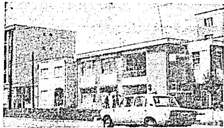
Chișineu Criș — aspect din centrul orașului.