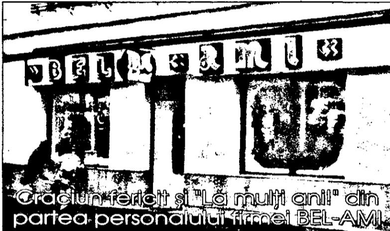
Crăciun fericit și "La mulți ani!" din partea personalului firmei BEL-AMI

În zilele de 23-24 decembrie, la Sala Sporturilor, se desfășoară turneul de minifotbal dotat cu "Cupa de Crăciun", la copii, categoria de vîrstă 10-13 ani. Participă echipele de copii ale cluburilor UTA, Aris, Astra și CSS Gloria-Arad.