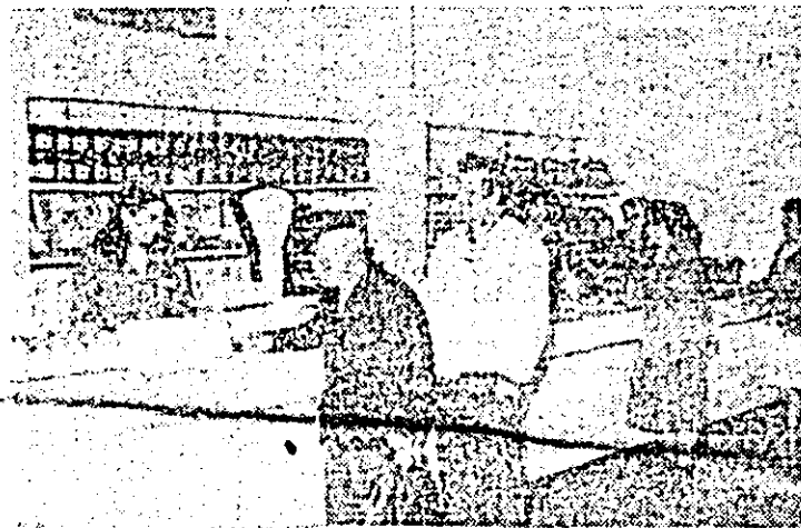
Se extinde continuu rețeaua comercială arădeană. În clienți o nouă unitate dată în folosință: alimentară nr. 21 de pe strada Spitalului.