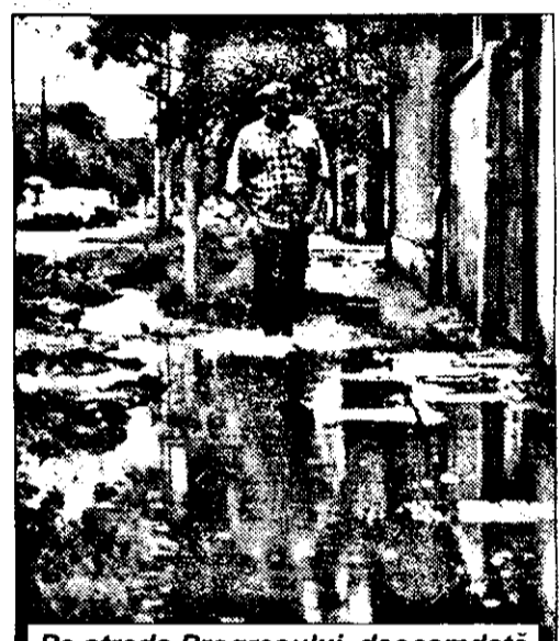
Pe strada Progresului, deocamdată apa a ajuns până la gleznă