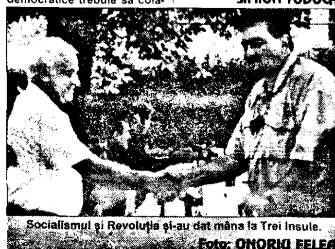
Socialismul și Revoluția și-au dat mâna la Trei Insule.