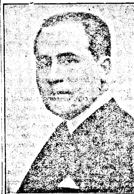
D. Miliță Constantinescu, ministru de finanțe

Aceasta subliniază deosebirea între ceea ce a fost și între ceea ce este. Trecutul regim politic cu toate neajunsurile lui, nu mai poate fi înfronat, când guvernul Frontului Renașterii Naționale, dă atâtea splendide rezultate.