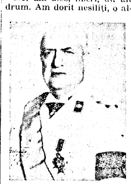
Dr. Constantin Argetoianu Președintele Consiliului de Miniștri

Noi am ales, liberi, un alt drum. Am dorit nesiliți, o al-