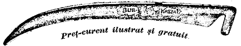
Preț-curent ilustrat și gratuit.

Coasa de oțel „Bur“ numai atunci este veritabilă, dacă pe mâner poartă gravată inscripția aceasta: W. G. Kőbánya , iar pe latul ei este tipărirea marca firmei cum arată figura asta: 190 3—20