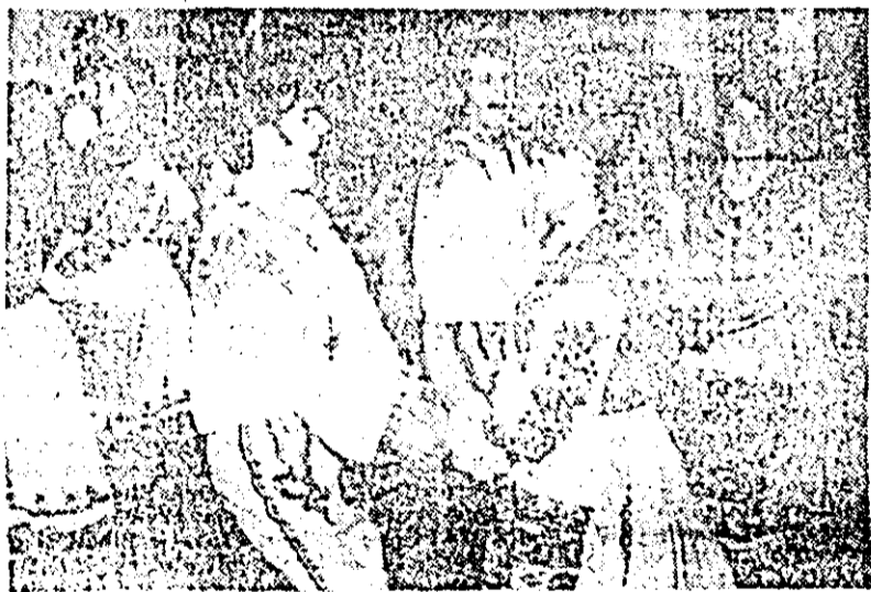
Trumoasele dansuri populare din zona Ineului au cucerit de mult inimile și aplauzele spectatorilor.