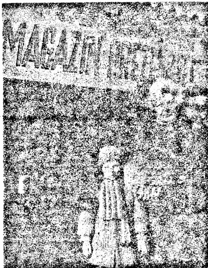
50 de lei o plîncă Deocam dată...