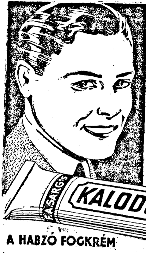
A HABZÓ FOGKRÉM

Ezóta Emma anyakirályné visszavonultan élt a hágai királyi palotában, ahol most háromnapos szenvedés után csendesesen elhunyt. Halálos ágyánál ott állott leánya, Vilma királynő, Juliana trónörökös és Waldeck herceg, az elhunyt fivére.