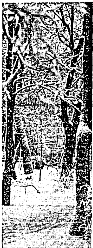
„Ghiocii” acestei neprevăzute primăveri.

— Care este stadiul actual al pregătirilor?