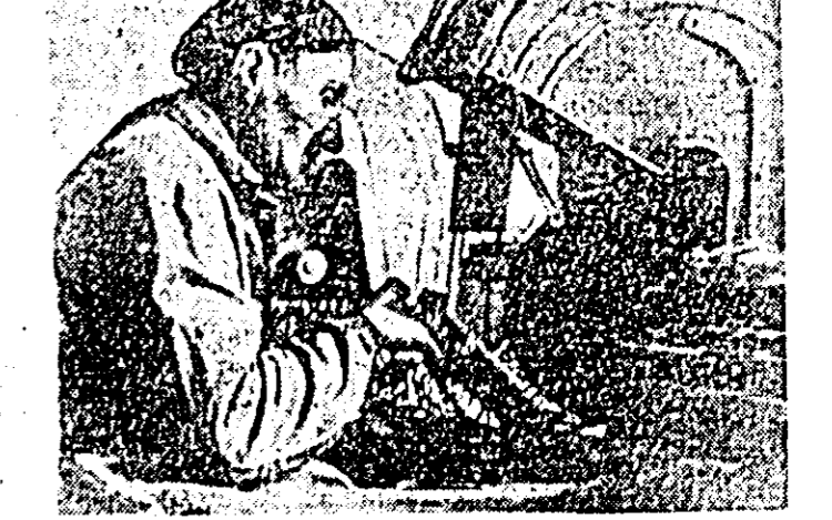
Tovarășul Iosif Gômori este unul din fruntașii în muncă ai secției de plan, cea mai mică depășire fiind de 38 la sută.