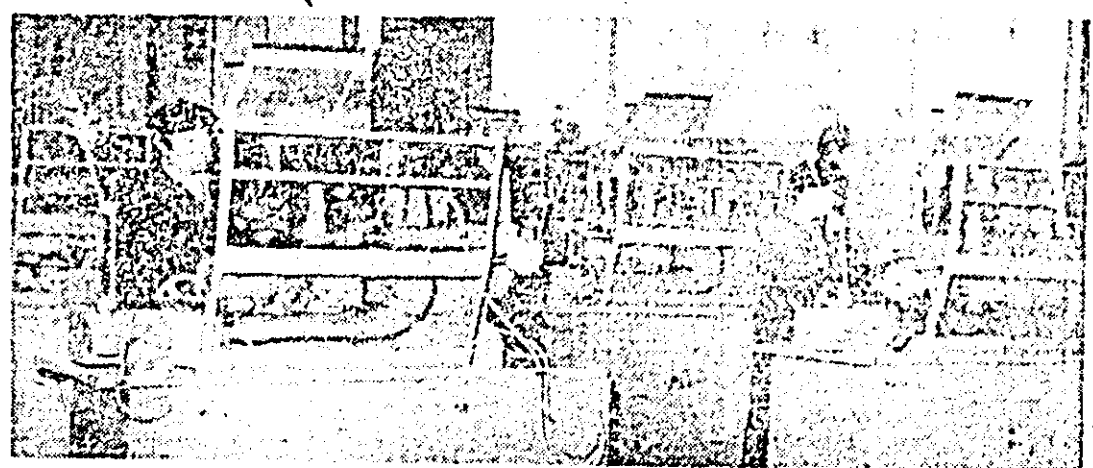
Aspect de muncă în secția montaj a întreprinderii de mașini-unelte Arad.

Președintele Nicolae Ceaușescu a subliniat că în prezent este necesar să fie intensificate acțiunile politice și diplomatice pentru a se ajunge la o soluție pe cale politică, la o pace justă și durabilă în Orientul Mijlociu, bazată pe retragerea trupelor israeliene din teritoriile arabe ocupate în urma războiului din 1967, pe recunoașterea dreptului poporului palestinian la autodeterminare și la crearea unui stat propriu, independent, pe asigurarea independenței, suveranității și securității tuturor statelor din această regiune.