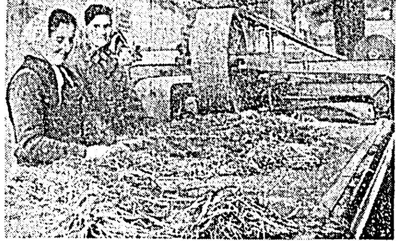
La Fabrica de cîmpă din Iratoș procesul de producție se desfășoară din plin.

Ca în fiecare an, TAPL organizează și în această lună tradiționala „Lună a preparatelor culinare”. Printre acțiunile inițiate în perioada acestei luni amintim expozițiile cu preparate culinare reci, organizate în fiecare vineri din săptămîna la 3 unități, (bufete și restaurante) cele două expoziții de cofetărie și patiserie organizate vineri și sîmbătă la cofetărie, o consfătuire cu consumatorii la restaurantul „Clocișia”, precum și alte acțiuni menite să popularizeze preparatele culinare ce se pregătesc în cadrul TAPL.