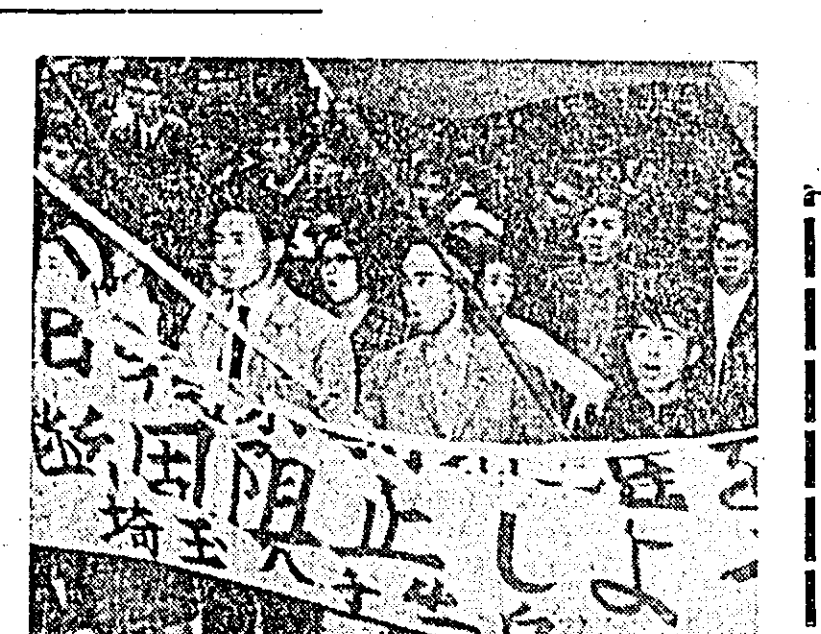
JAPONIA. — Din inițiativa Federației naționale a studenților, sute de studenți de la Universitatea Waseda din Tokio și de la Universitatea Tokio au organizat mitinguri de protest împotriva ratificării tratatului japoano-sud-coreean.

Sindicatul muncitorilor și funcționarilor de la căile ferate de stat și particulare, care reunește peste 1.500.000 de membri, muncitorii și funcționarii de la companiile de taxime, lucrătorii din transporturile în comun, au făcut cu noșcută hotărârea lor de a participa la această acțiune. Amplora pregătirilor oamenilor muncii japonezi în vederea acțiunilor greve comune a provocat neliniștea cercurilor conducătoare. Astfel, ministrul muncii, ministrul poștei și telecomunicațiilor, precum și reprezentanți ai diferitelor instituții de stat au avertizat că participanții la vîltoarea „grevă vor fi aspru pedepsiți”.