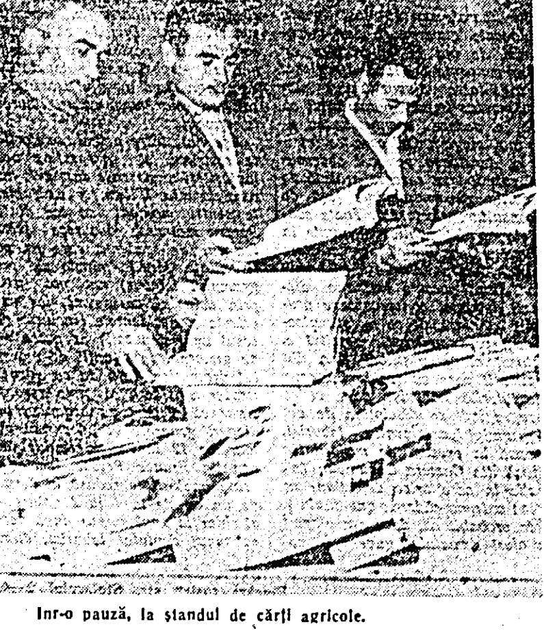
În-o pauză, la ștandul de cărți agricole.

Pe baza planului de măsuri elaborat de Consiliul agricol raional, fiecare unitate cultivatoare de legume să-și întocmească planul de măsuri propriu care să cuprîndă toate problemele legate de sporirea, eșalonarea și valorificarea producției legumicole în anul 1968, plan care să fie cunoscut de toți cooperatorii. Organizațiile de partid au datoria de a urmări și a îndruma temeinic îndeplinirea cu succes a măsurilor respective în vederea realizării sarcinilor stabilite de Congresul al IX-lea al PCR.