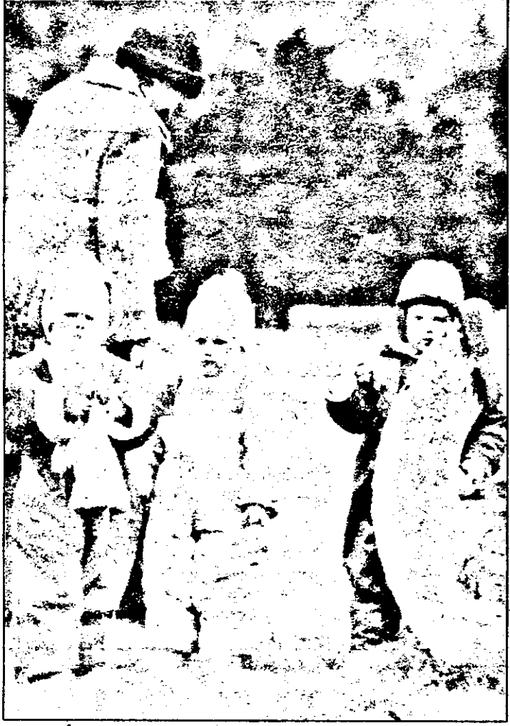
De ce nu ninge, oameni buni?