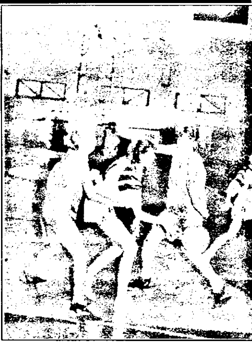
Braşoveanca Hânda nu are sorti de izbândă în fața surorilor Nițulescu. Secvență din meciul B.C. Arad - Fartec Braşov 69-59.

P.S.: În cadrul etapei a XIV-a, sâmbătă 18 decembrie a.e., la București, Sportul - B.C. Arad, un meci important pentru configurația clasamentului. Succes fetelor!