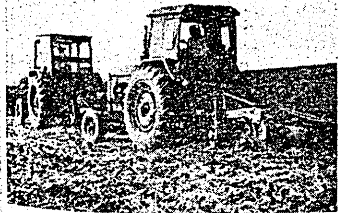
Pe ogoarele Șiriei, se pregătește terenul pentru viitorul recoltă.