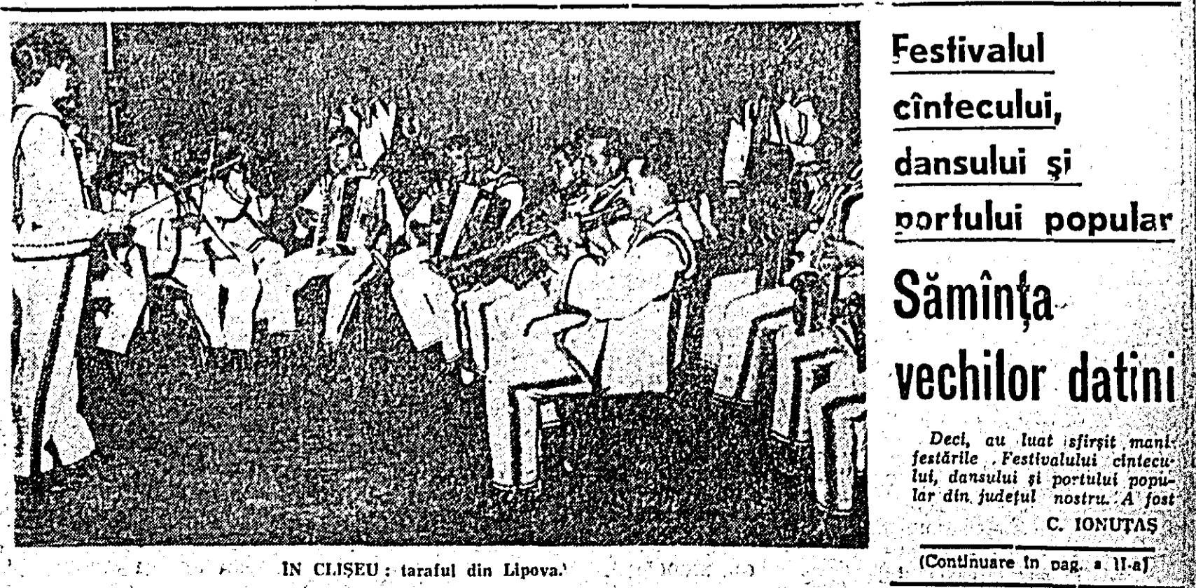
IN CLISEU: taraful din Lipova.