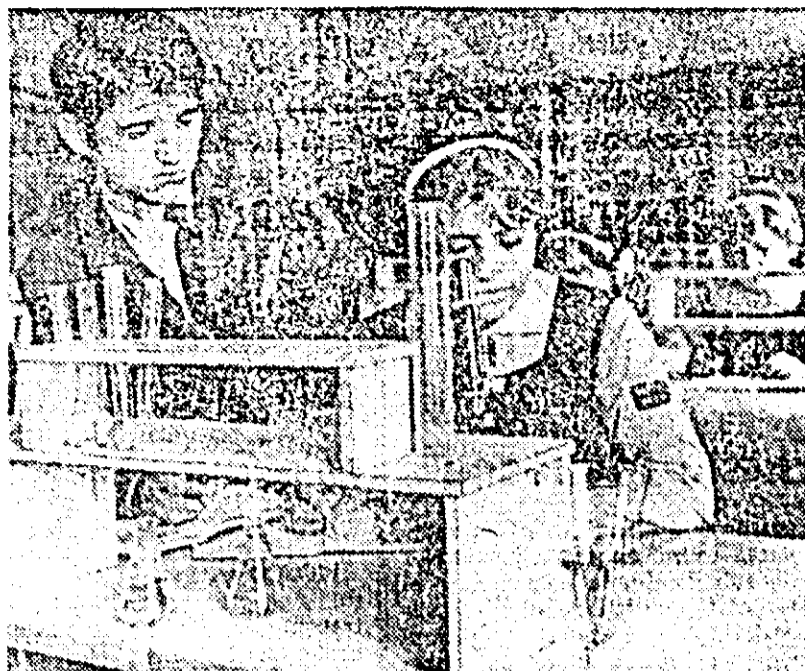
Oră de laborator la Școala profesională „30 Decembrie”