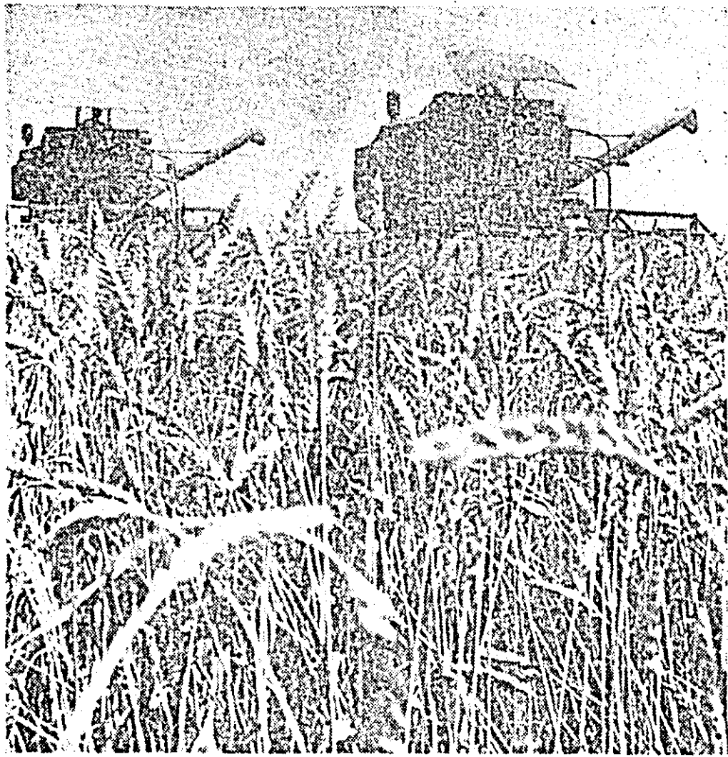
Doi „Glorii” se întrec să adune aurul pîinii de pe lînssele ogoare ale Nădlacului.