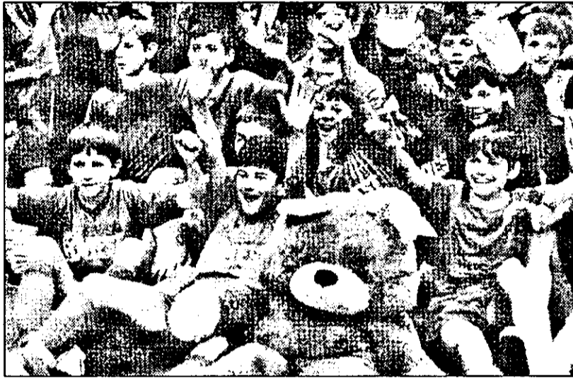
În imagine, o parte din micuții fotbaliști de la AS Romvest '84, surprinși la festivitatea de deschidere a competiției.

existat porțiuni mari de drum acoperite cu gheață sau zăpadă, o dată întrați pe autostrăzile austriece, am rămas perplecși. Deși pe marginea drumului zăpada era de aproape un metru, șoseaua era uscată. ● Deși am ajuns cu aproape două ore întârziere, organizatorii au modificat programul primei zile și