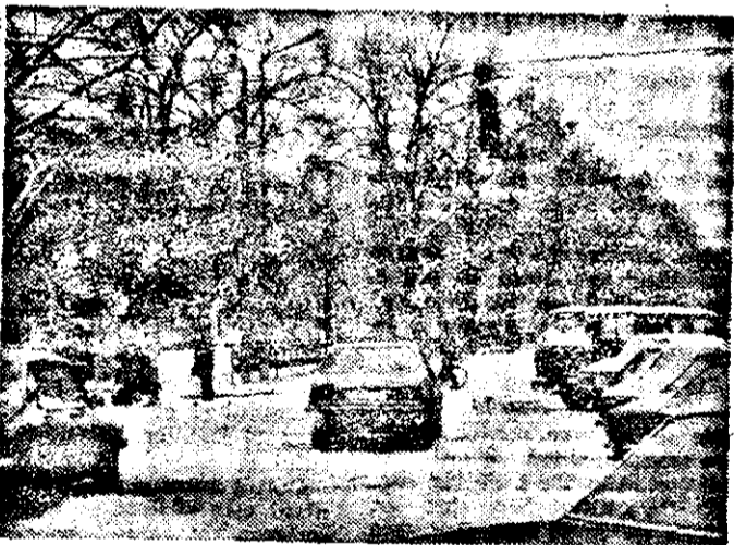
Iarna pe... ulișă...