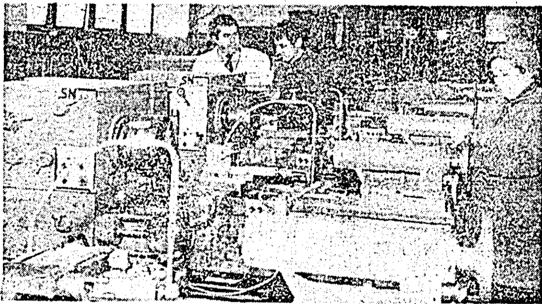
Aspect de muncă în atelierul montaj al Fabricii de strunguri Lipova.