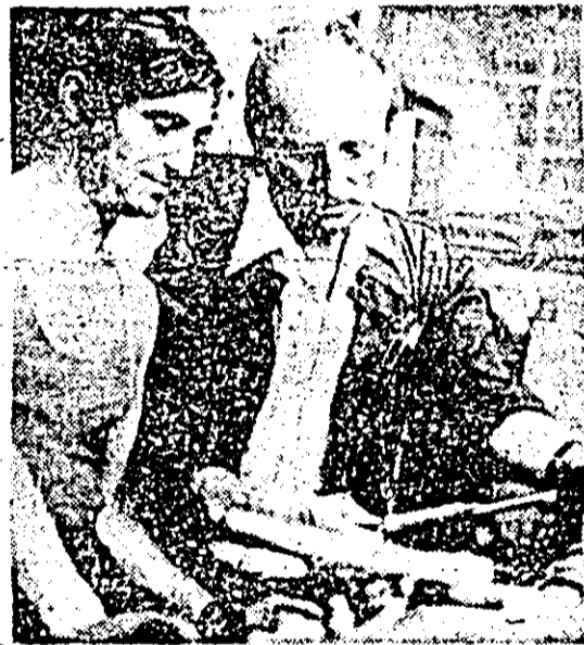
Colectivul de muncă de la I.M.A.I.A. Intîmpinîndu-l cu reușite deosebite marea noastră sărbătoare națională de la 23 August.