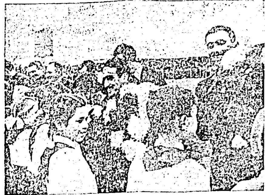
Numeroși pionieri din orașul nostru oferă flori sportivilor sovietici, pe stadionul „30 Decembrie”