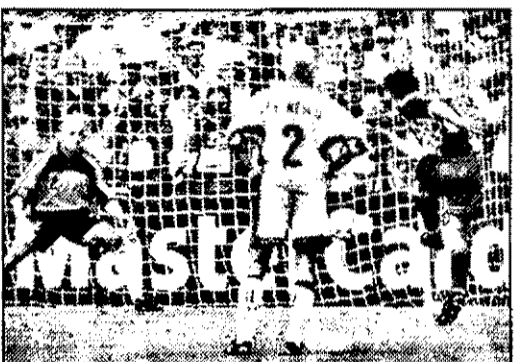
Sub privirea lui Dan Petrescu, Suiker înscrie din penalty, ducând Croația în sferturi

care o reprezintă, de altfel, fără palmares internațional. Cei doi-trei jucători de valoare pe care îi are nu reprezintă totuși un