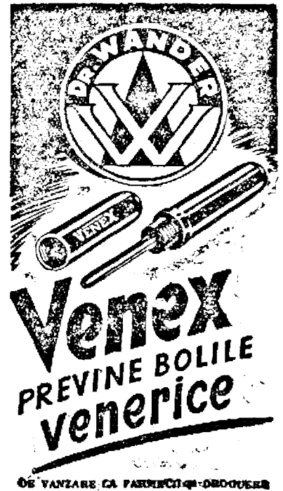
DE VANZARE LA FARMACII ȘI DROGUERII