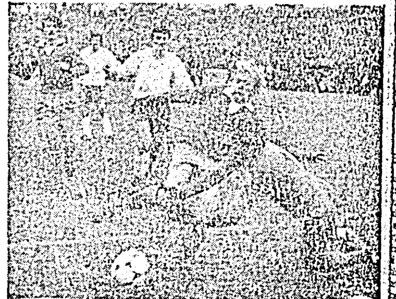
Portarul hunedorean salvează în ultimă instanță din pierzările lui Leac.