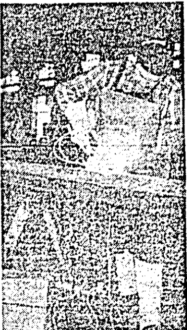
În atelierul de prototipuri al întreprinderii de vagoane, sudura în mediu de dioxid de carbon, prin care se asigură o calitate superioară, se extinde continuu. Fotografia alăturată îl înălță pe sudorul Dumitru Segheidi, folosind cu bune rezultate acest procedeu.

re au dat peste prevederile în săptămîna desfășurării Congresului, aproximativ 30.000 bucăți tricotoaje în plus. De asemenea, oamenii muncii de la „Victoria” au realizat suplimentar 800 ceasuri, cei de la întreprinderea de bunuri metalice — 1.200 umbrele și 2.500 ochelari și rame, iar la „Arădeanca” a fost livrat suplimentar la export un vagon de păpuși în valoare de 95.000 lei valută.