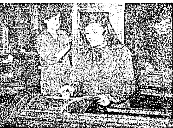
C.P.L. Aspect de muncă în secția (Inisa)

tilizat și erbicidat tot ce am însămânțat, această ploaie vine cum nu se poate mai bine și asigură condiții, mă încred că spun, ideale pentru răsarrea și dezvoltarea rapidă a tuturor culturilor din acest an. Așa că în acest an nădăjduim să obținem producții care să bată toate recordurile din județ, iar recoltele planificate și angajamentele luate în întrecerea socialistă pe 1985 trebuie scoțite ca minime.