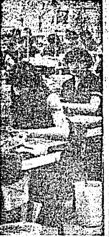
Aspect de muncă în secția pictură a Întreprinderii „Arădeanca”.