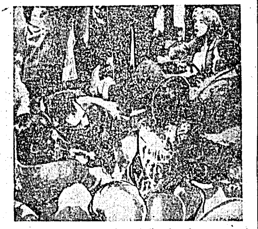
Aspect de la o recentă demonstrație prin ședere care a avut loc la Chicago (S.U.A.) în fața clădirii unde se desfășoară ședința Comisiei Camerei reprezentanților pentru cercetarea activității anti-americane.

WASHINGTON 17 (Agerpres). La cererea delegațiilor republicilor Chile și Venezuela, Comitetul consultativ ministerial al OSA a ținut miercuri o ședință pentru a examina situația creată în urma re-luării ostilităților la Santo Domingo. În ciuda acordului intervenit pentru încetarea focului. În cadrul ședinței, reprezentanții Venezuelei, Perului și Republicii Chile au adresat critici severe împotriva forței interamericane cit și a comisiei speciale a OSA. Acuzările aduse comisiei speciale, care se compune numai din reprezentanții SUA, Braziliei și Salvadorului, s-au referit la faptul că aceasta nu a ținut Comitetul consultativ la curent cu negocierile în treptării crizei dominicane. Explicații în acest sens au fost cerute secretarului general al OSA, Jose Mora. În răspunsul său, Mora a subliniat „extremele dificultăți” de a găsi o modalitate de rezolvare a crizei. Potrivit spuselor sale, dificultățile se datorează faptului că în timp ce guvernul constituționalist al colonelului Caamaño insistă asupra respectării constituției din 1963, guvernul generalului Imbert respinge aceste propuneri. Mora a declarat că se va însoți schimbă la Santo Domingo pentru a continua sondarea posibilităților realizării unui acord mai trainic. Pe de altă parte, la ședință s-a semnalat existența unui conflict între reprezentanții la Santo Domingo ai ONU și cei ai OSA. Aceasta a reieșit dintr-un raport al generalului brazilian P. Alvin, comandantul forței interamericane.