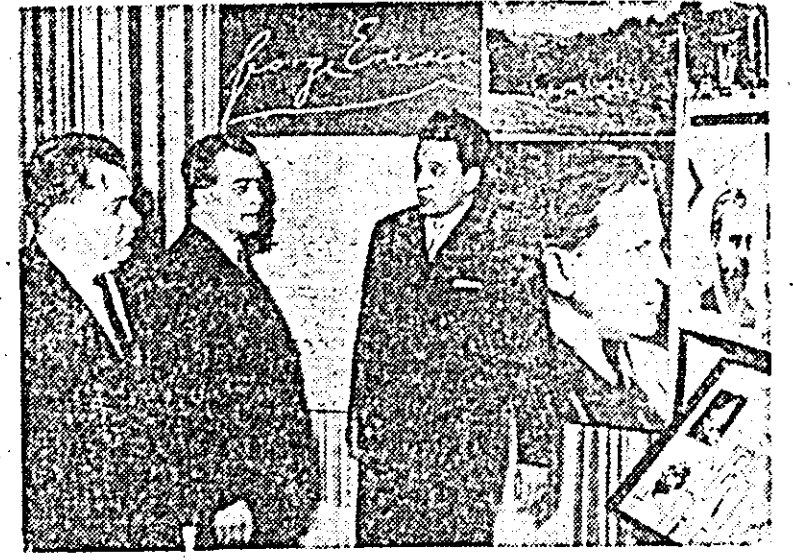
Cu prilejul comemorării unui deceniu de la moartea lui George Enescu, recent s-a deschis la Viena în sălile palatului Palfy, o expoziție comemorativă. În fotografie: aspect de la această expoziție.

WASHINGTON 17 (Agerpres). — Într-o cuvîntare rostită în Senatul SUA, William Fulbright, președintele comisiei senatoriale pentru afacerile externe, a afirmat că „se opune unei retrageri necondiționate” a SUA din Vietnamul de sud și că sprijină hotărîrea SUA de a continua ajutorul militar acordat guvernului de la Saigon. El a precizat totodată că se opune escaladării continue a războiului din Vietnam, deoarece aceasta ar împinge Statele Unite într-un război de junglă și de lungă durată.” Fulbright a arătat că o victorie militară completă în Vietnam nu poate fi obținută „decît cu un preț ce depășește cu mult cerințele intereselor noastre și onoarei noastre”. „Nu poate fi dezonorat faptul — a adăugat el — că au existat greșeli în decursul anilor în politica noastră din Vietnam dintre care încurajarea acordată președintelui Ngo Dinh-Diem, de