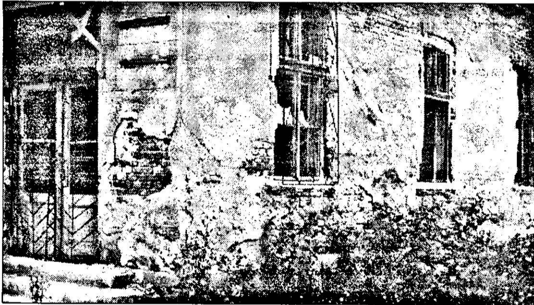
Sala „Puşkin” - la un pas de prăpăd...