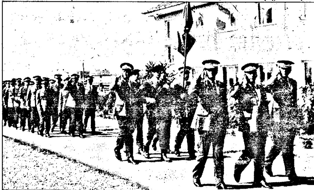
Jandarmii defilează în acordurile fanfarei militare, sub privirile pline de emoție ale părinților și prietenilor.

ADRIAN BOROS (Continuare în pagina 2-a)