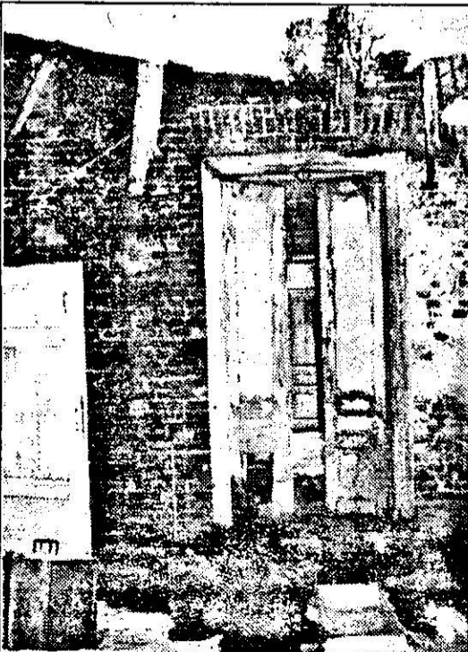
O „rampă de gunoi” bine amenajată într-o instituție de cultură. Ne-ntrebăm ce „cultură” s-a făcut de s-a ajuns aici...