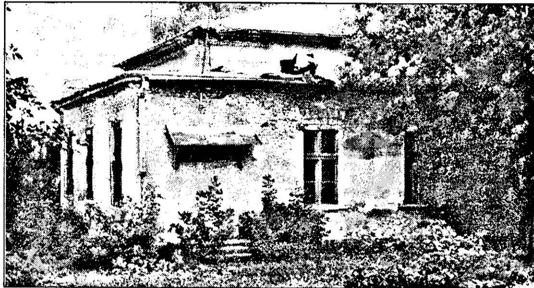
Printre boscheți și gunoaie mai stă „în picioare” o veche Casă de Cultură.

Pe strada Dorobanților la nr. 37-39 stă să se dărâme o construcție impresionantă ce până nu demult era Casă de Cultură. Aici se desfășurau activități culturale, nunți și alte manifestări de acest gen. După revoluție clădirea a intrat într-un con de umbră, fiind uitată de toți cei ce ar fi trebuit să se ocupe de ea. Casa de Cultură „Puşkin”, sub denumirea cunoscută de arădeni, a fost inaugurată în anul 1902, atunci fiind Casa de Cultură a Tineretului din Pârnea. La cei aproape o sută de ani de existență, clădirea necesită reparații serioase din cauza deprecierii în primul rând a acoperișului. Nu putem omite și faptul că de aici s-a furat cam tot ce s-a putut fura. Inclusiv instalația electrică a dispărut.