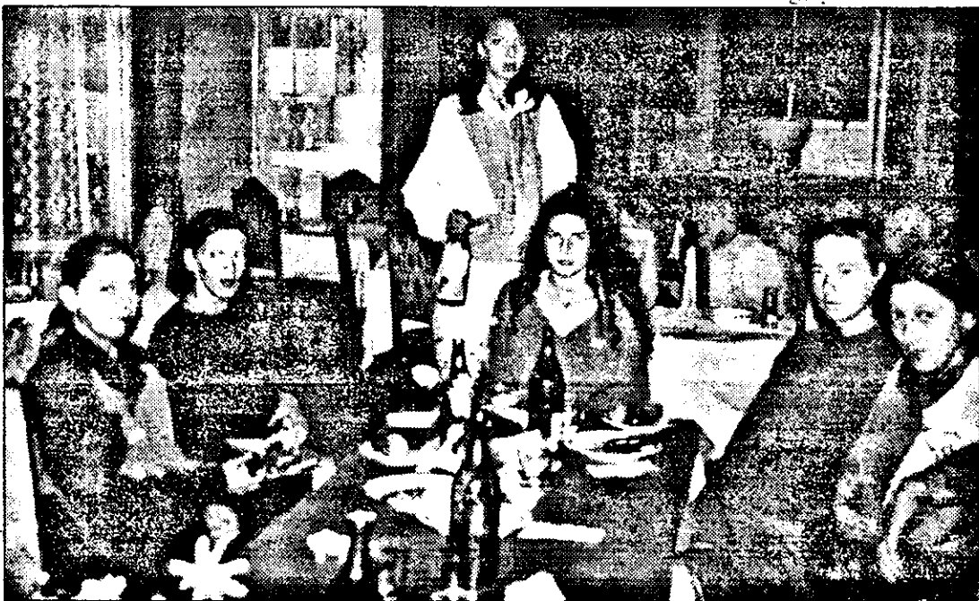
Momente de repaus, în restaurantul hotelului, după epuizantul antrenament de dimineață

Pentru aceasta însă, după revenirea în Arad va trebui să facă față la două antrenamente, zilnic, iar apoi la participări în turnee de verificare: la Dej (16-18 august) la Timișoara (22-25 august) cu Vrșet și Zalaegerszeg, în Capitală (ACRO) și la poalele Tâmpel (Fartec Brașov).